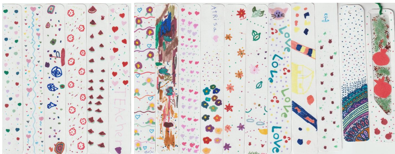
1-2-3-4-5-6-7-8-9-10-11-12-13-14-15 نشانه ی کتاب